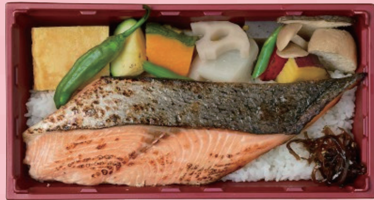
熟成漬け焼き弁当 サーモン