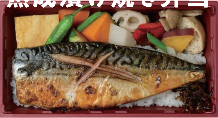
熟成漬け焼き弁当 鯖