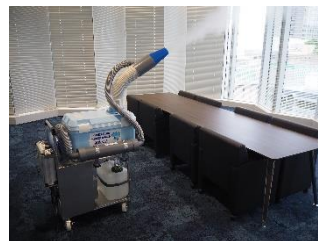
定期的な消毒作業