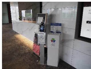
入口での検温・消毒の実施