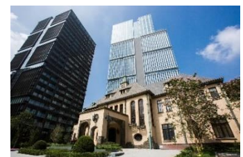
東京ガーデンテラス紀尾井町